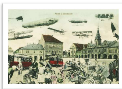
Kapesní kalendářik vydaný na konci roku 2022