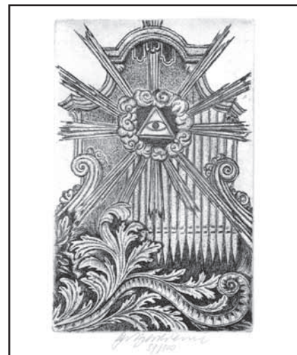
Autorkou grafického listu dárcům za rok 2008 je akademická malířka Olga Vychodilová . Mecenáš, podporovatelé a partneři projektu jej obdrželi na benefičním koncertu dne 17. května 2009.