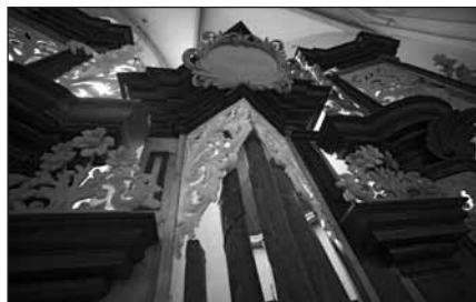
„Současné“ květiny na barokním prospektu.