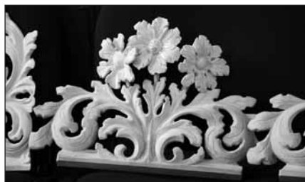
Nové rozkvetlá – vyřezaná – květina.

Některé díly prospektu byly zcela poničené nebo ztraceny – ty musely vzniknout nové. Příkladem jsou květiny, které nejprve byly předkresleny – na základě dochovaných fotografií a citu pro „rukopis“ barokního řezbáře.