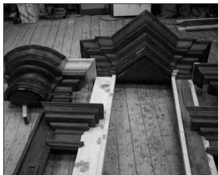
Část konstrukce prospektu v dílně restaurátorů.