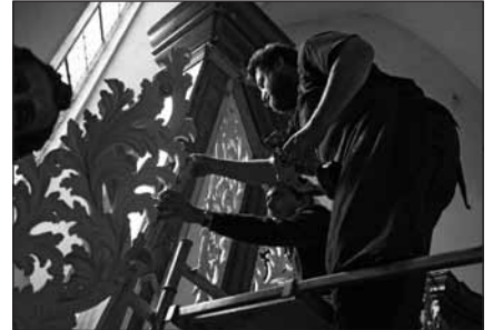
Instalace varhanního prospektu 10.–11. září 2009.

Restaurátory zachráněný prospekt barokních varhan se vrátil v září 2009 do kostela sv. Petra a Pavla v Mělníku, zatím do jižní boční lodí.