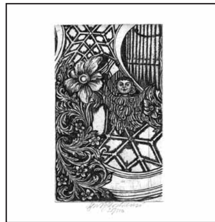
Autorkou grafického listu dárcům za rok 2007 je akademická malířka Olga Vychodilová , podporovatelé a partneři projektu jej obdrželi na benefičním koncertu dne 20. dubna 2008.