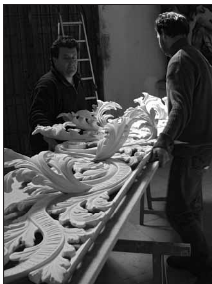
Jedna ze dvou největších řezeb se po restaurování vrací na Mělník 16. 4. 2008