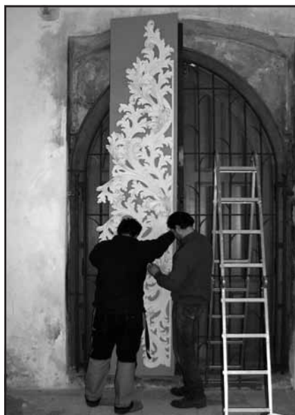
Řezba barokního prospektu vysoká 3,5 m je instalována na své dočasné místo v kostele