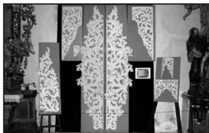
Dosud zrestaurované řezby jsou prozatím umístěny v jižní lodi kostela