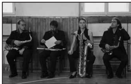
Místa známá i neznámá v mělnickém Tyršově domě se saxofonovým kvartetem Bohemia