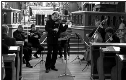
Závěrečný koncert Dnů pro varhany s Concertem Praha