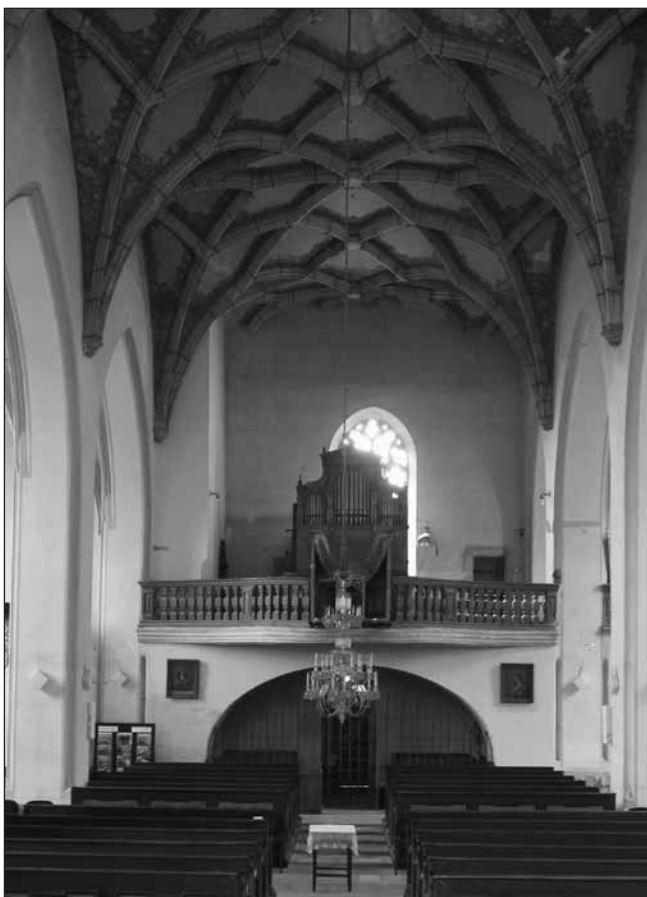
Pohled na kůr kostela sv. Petra a Pavla s provizorními varhanami firmy Rejna – Černý z roku 1898 (MURUS, 2010)

Pro realizaci projektu obnovy varhan uzavřel MOOS smlouvu s Římskokatolickou farností – Proboštstvem Mělník.