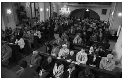
Posluchači benefičního koncertu 2010