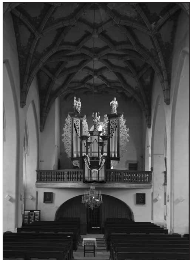
Pohled na kůr kostela sv. Petra a Pavla – fotomontáž varhan, předpokládaný budoucí stav (MURUS, David Halva, 2010)