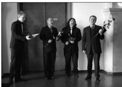
Místa známá i neznámá – Q VOX na mělnické radnici