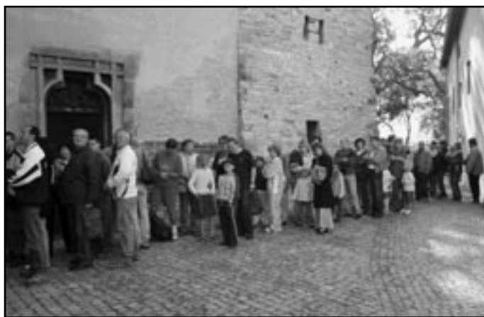
Zájemci o pohled z věže