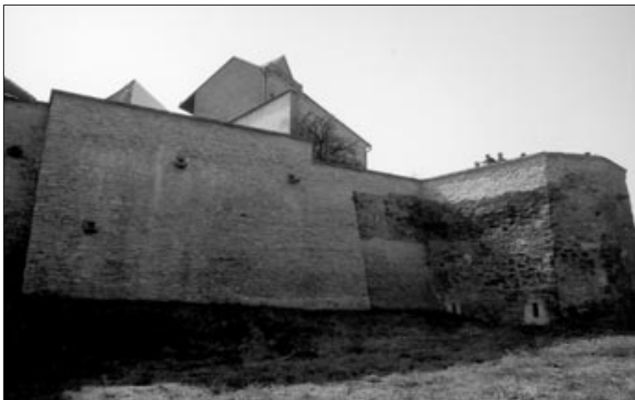
Parkánová bašta v Jungmannových sadech

Má to současník opravdu učinit? Nepronikly metastázy příliš hluboko do těla společnosti a kdosi stojí již před bránami Říma? Říká se, že nebezpečné jsou ne-