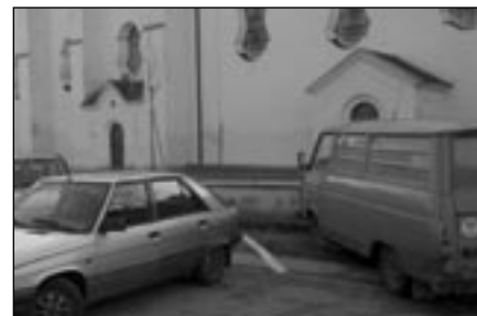
Čertovská ulice, duben 2005

Závěrem nám dovoluete citovat Vaše úvodní slova ze sborníku Mělník – Pšovka, který byl vydán Městem Mělník k ukončení obnovy kostela sv. Vavřince postiženého povodní: