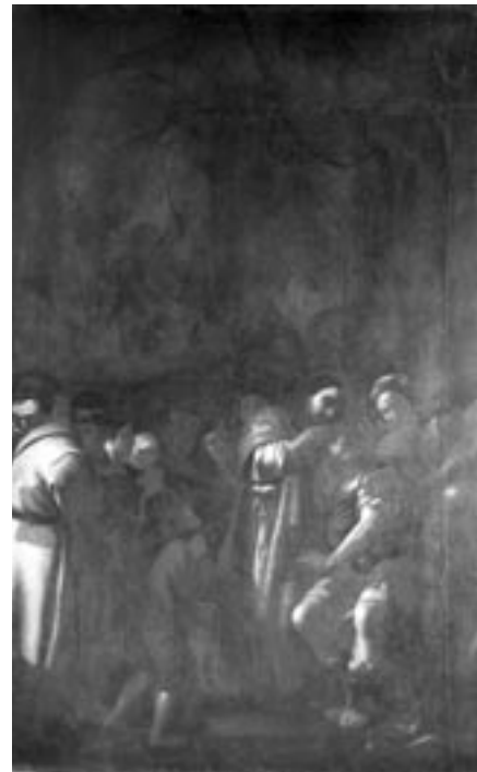
Karel Škréta Svatý Vavřinec, hlavní oltář kostela sv. Vavřince v Mělníku - Pšovce

čedník raného křesťanství v době vlády císaře Valeriána. Ten začal opět křesťany pronásledovat a nařídil, aby kněží opustili Řím. Papež Sixtus II. byl uvězněn a popraven, Vavřinec však, jako nejvyšší ze sedmi jeho jáhnů, pokračoval ve své činnosti šíření slova božího a také křtil. Do úschovy dostal Vavřinec drahocenné nádoby, které sloužily při liturgických obřadech a o které jako jáhen asistující