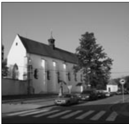
Čertovská ulice, červenec 2004