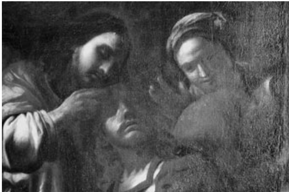
Karel Škréta Svatý Vavřinec, hlavní oltář kostela sv. Vavřince v Mělníku - Pšovce, detail