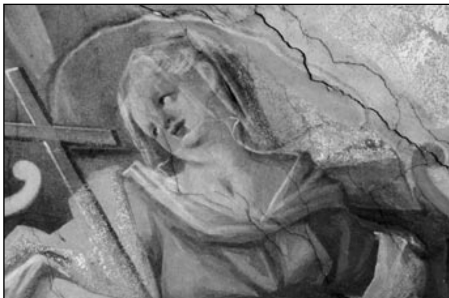
Jan Ezechiel Vodňanský: Personifikace Víry (detail nástropní malby), kostel Nanebevzetí P. Marie a sv. Mořice v Řevnicích, po roce 1749, foto: Martin Mádl