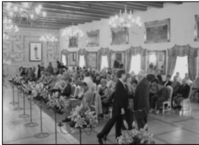
Místa známá a neznámá v koncertním sále mělnického zámku

Doba měla svůj odraz v umění. V 17. století vzniká poslední univerzální umělecký sloh nazývaný baroko. Barokní umění se vymanolilo ze sevřetí renesančních uměleckých zásad, přineslo dynamiku, pohyb, dramatictost, a tím i schopnost uchvátit lidskou duši. Baroko přineslo skvělou podívanou v režii geniálních umělců.