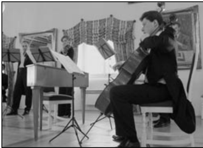
Místa známá a neznámá v koncertním sále mělnického zámku