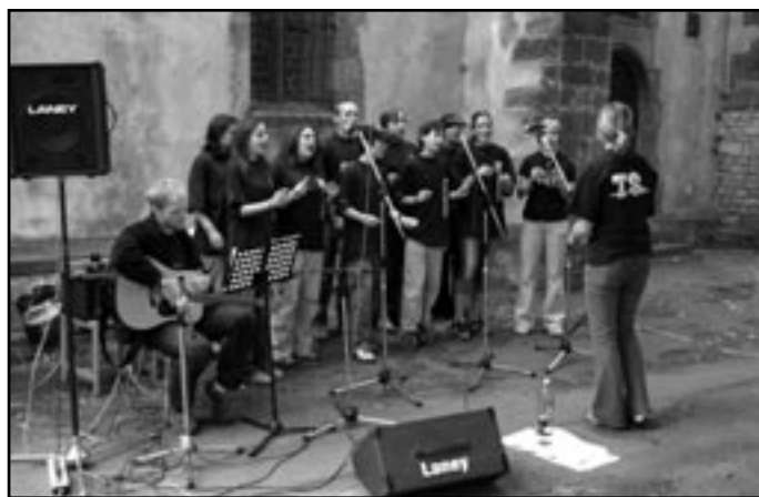
Vystoupení TenSingu Mělník

Děkujeme také všem, kteří přišli a podpořili nás, organizátory (Mělnický osvětový a okrašlovací spolek, Římskokatolická farnost - Proboštství Mělník, Římskokatolická farnost Mělník - Pšovka, Město Mělník), a především památky, jež nás potřebují.