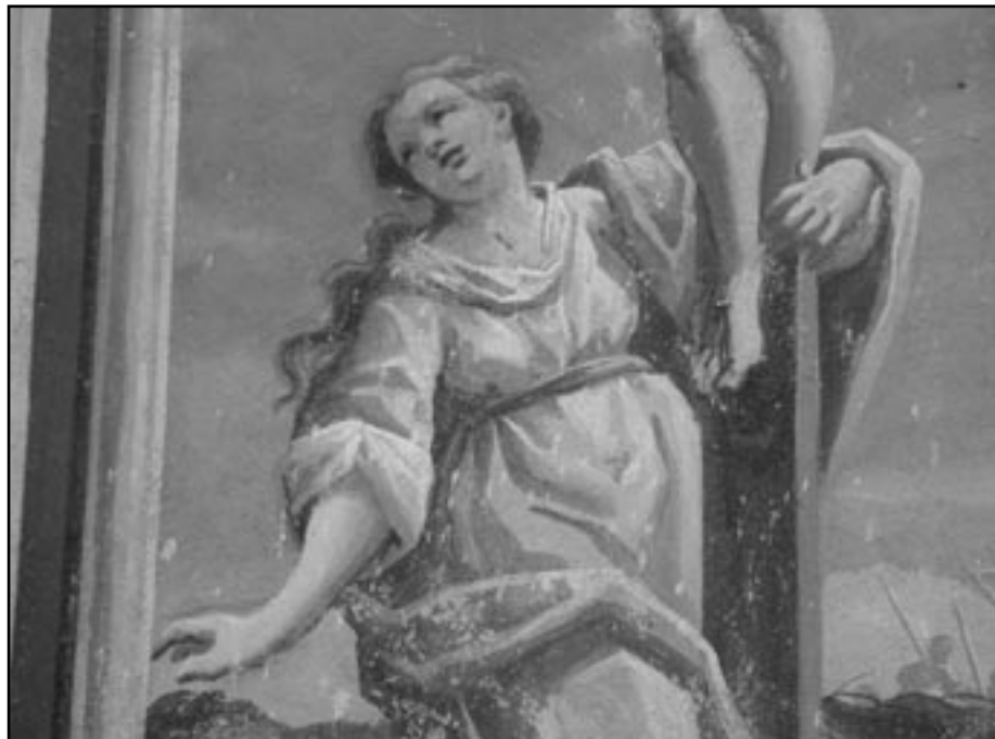
Jan Ezechiel Vodňanský: Ukřižovaný Kristus (detail nástěnné malby), kostel sv. Vavřince v Mělníku – Pšovce