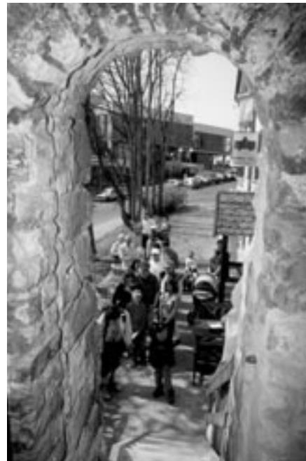
Vodárenská věž vítá návštěvníky

schůdků umožňujících snadný nástup do Vodárenské věže (nadále budou při obdobných akcích využívány)